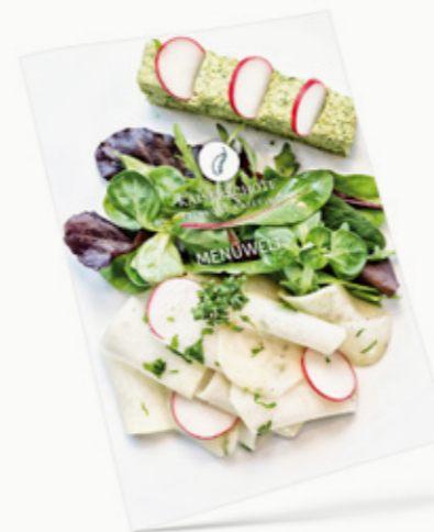
MENÜS & FLYING BUFFET

Mehr Catering Ideen finden Sie in weiteren Kaiserschoten Magazinen.